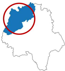
Nord Indre et Loire

La zone de collecte auprès de nos producteurs, s'étend sur un rayon de 30kms autour de notre siège (qui se trouve sur Souvigné 37330). 80 % de nos producteurs se trouvent dans cette zone. Les 20% restant n'excèdent pas les 70kms de distance.